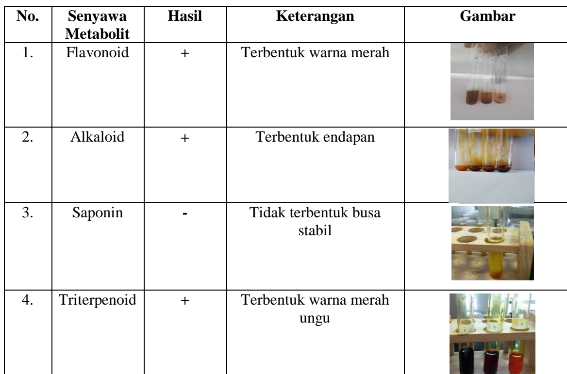
Tabel 3. Gambar Uji Penapisan Fitokimia