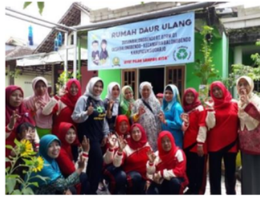
Gambar 2. Sosialisasi Pemilahan sampah dan dampak sampah bagi kesehatan