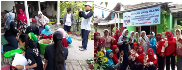
Gambar 1. Pengelolaan Sampah dengan Sistem Takakura dan Pupuk Cair

Pada pengelolaan sampah secara takakura, warga desa Balongbendo tampak antusias untuk mengikuti kegiatan tersebut. Pada pembuatan pupuk