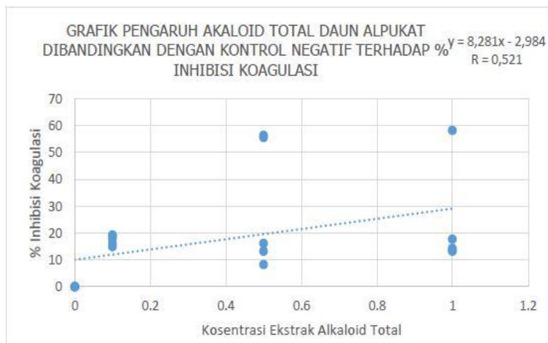
Gambar 4.3 Hasil Uji Korelasi antar Konsentrasi Ekstrak Alkaloid Total Daun Alpukat Terhadap Persen Inhibisi Koagulasi