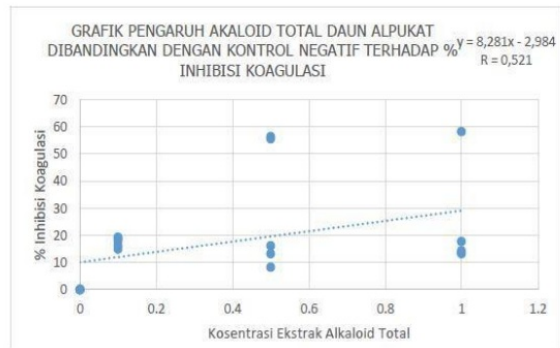
Gambar 4.3 Hasil Uji Korelasi antar Konsentrasi Ekstrak Alkaloid Total Daun Alpukat Terhadap Persen Inhibisi Koagulasi