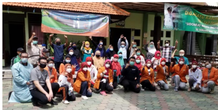
Gambar 3. Kegiatan pendampingan pasien Prolanis Puskesmas Trosobo

Pengaturan pola makan diketahui dapat menstabilkan kadar glukosa darah dan tekanan darah dalam batas normal. Selain itu, aktivitas fisik diketahui juga dapat menurunkan kadar gula darah tekanan darah normal. Otot dalam tubuh menggunakan glukosa untuk mengisi kekurangan glukosa yang telah digunakan untuk beraktivitas. Adapun pada sistem metabolisme pasien yang aktif melakukan aktivitas fisik, glukosa darah yang terdapat dalam darah dapat dimetabolisme pada saat melakukan olahraga dan memperlancar peredaran darah (Dayanti, 2019).