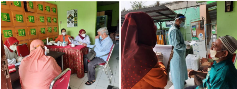
Gambar 2. Pemeriksaan kesehatan pasien peserta Prolanis

Program edukasi pola makan sehat melibatkan pasien dan salah satu anggota keluarga yang berperan sebagai perawat keluarga dan memegang fungsi kontrol perawatan kesehatan pasien Prolanis. Edukasi diberikan dengan pemberian booklet diet tinggi serat, rendah garam, dan indeks glikemik rendah yang mudah dipahami oleh pasien Prolanis. Penyampaian secara langsung memudahkan untuk berinteraksi dengan pasien. Tim pengabdian juga membagikan cara mengatur pola makan harian pasien dan contoh menu. Contoh menu makanan sehat ini dibagikan juga melalui grup Whatsapp untuk mempermudah komunikasi dengan memanfaatkan teknologi. Selain membagikan contoh menu makanan sehat, tim pengabdian juga memberikan video edukasi pola makan sehat melalui platform media digital agar mempermudah proses pemahaman pasien dan keluarganya.