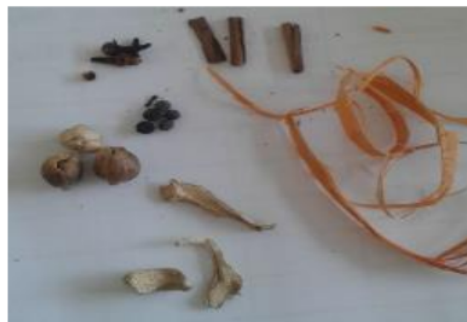
Gambar 3. Ramuan Secang di Desa Seloliman