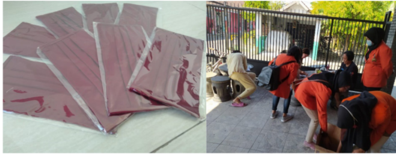
Gambar 3. Pembagian Masker ke Masyarakat

Sebagian warga berantusias dalam bertanya saat penyuluhan. Penyuluhan yang diberikan sebagian besar indicator dari pemahaman akan perilaku hidup bersih dan sehat yang masih jarang diketahui oleh masyarakat dan jarang diterapkan oleh masyarakat. Seperti Mengikuti penyuluhan covid-19 dan pemakaian masker.