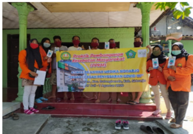
Gambar 4. Penyuluhan tentang Covid-19