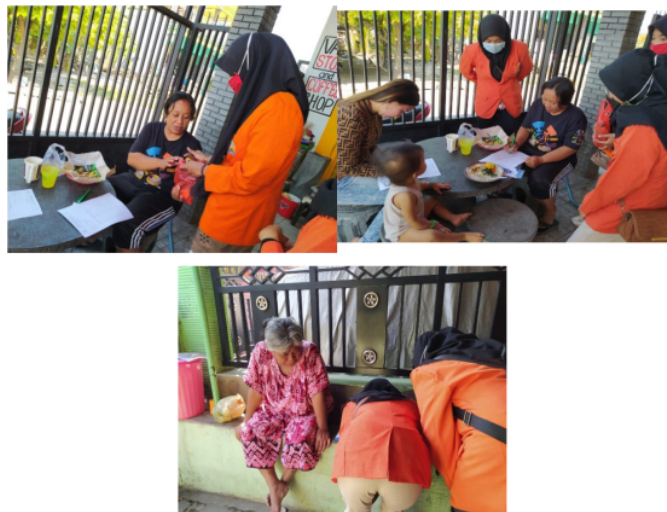
Gambar 3. Pengisian kuisioner (door to door) ke warga RT 04/05 Desa Kemangsen.

Pada saat penelitian ini dilakukan, belum terdapat kasus positif yang diketahui pada masyarakat di Kemangsen. Namun, kesadaran dalam menggunakan masker dapat terbilang cukup baik. Hal ini dapat disebabkan karena pengaruh media massa (Depkes RI, 2020).